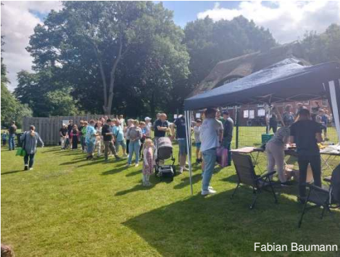
Großer Andrang bei der Tombola