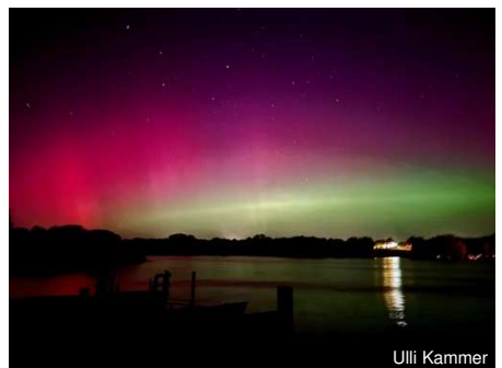
Polarlichter über Oeverdiek am 12.10.2024