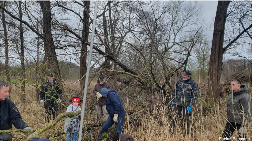
Aufräumen am Ankersee am 16.03.2024