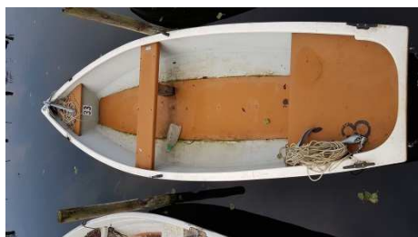
Boot vorbildlich für den nächsten Angler zurückgelassen

Vergesst nicht, euch die Teilnahme an den Gemeinschaftsarbeiten von den Gewässerwarten im Fangbuch quittieren zu lassen.