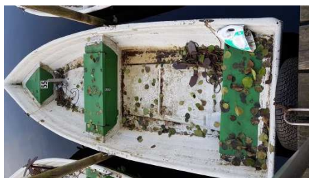
Ärgerlich für den nächsten Angler: Die Ankertaue sind verknäult statt vernünftig zusammengelegt